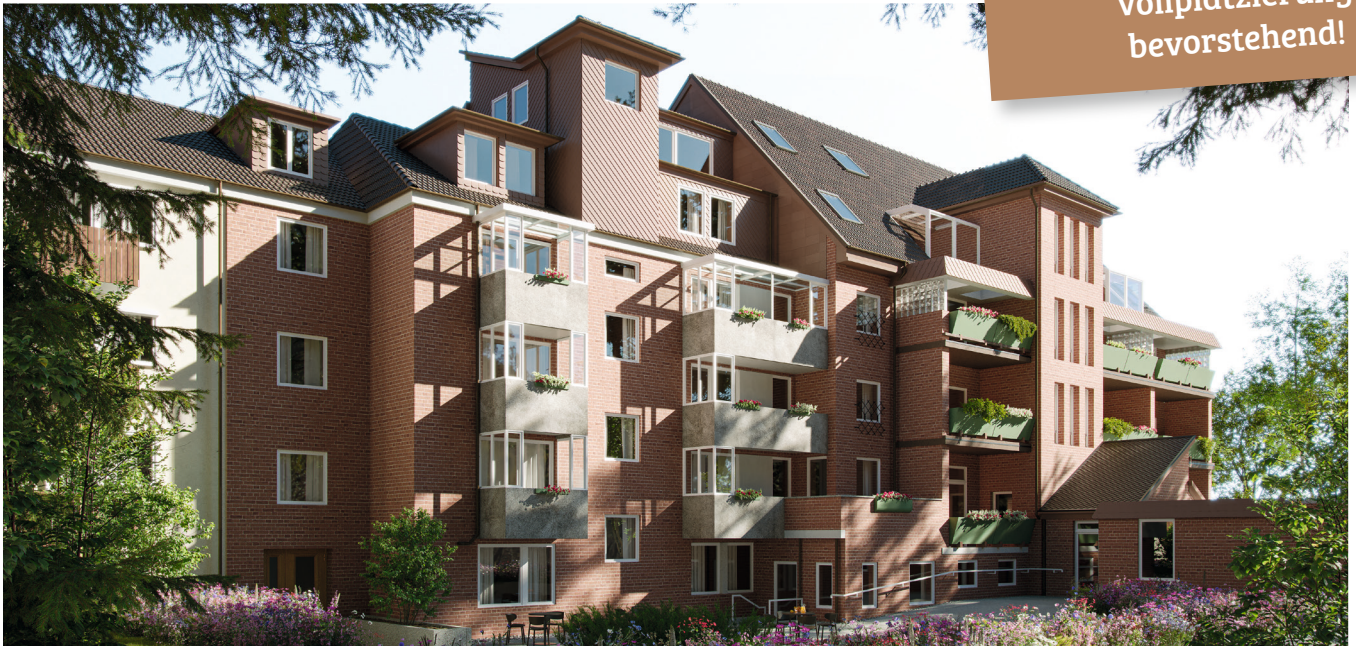
Das Verifort Capital HC1 - Fondsobjekt „Stationäre Pflegeeinrichtung Hannover“ (Innenhofansicht)