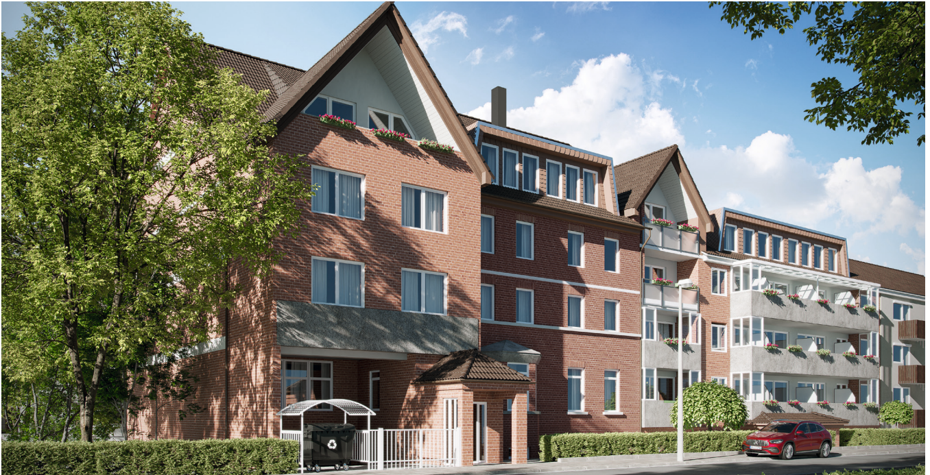
Das Verifort Capital HC1 - Fondsobjekt „Stationäre Pflegeeinrichtung Hannover“ (Straßenansicht)